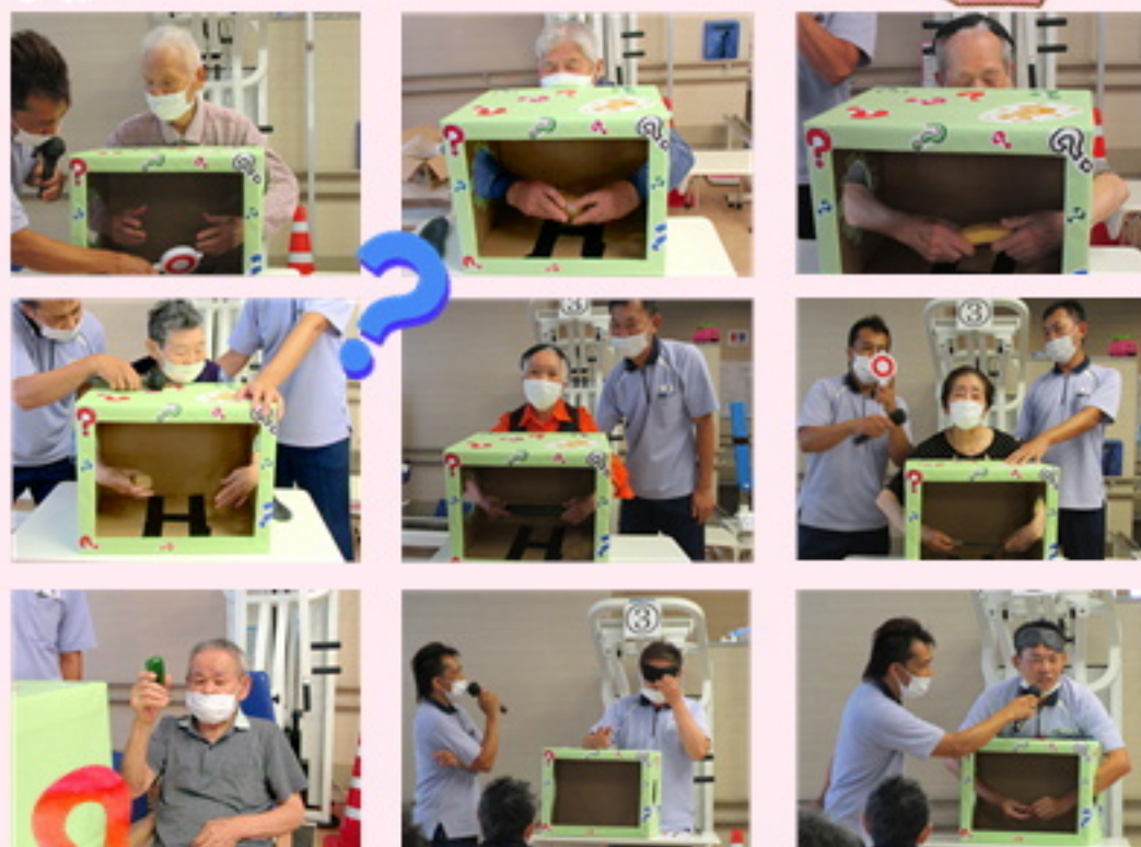
職員に関してはほぼイタズラ。激辛キムチやら濡らしたスポンジ等。皆さん、大うけでした。