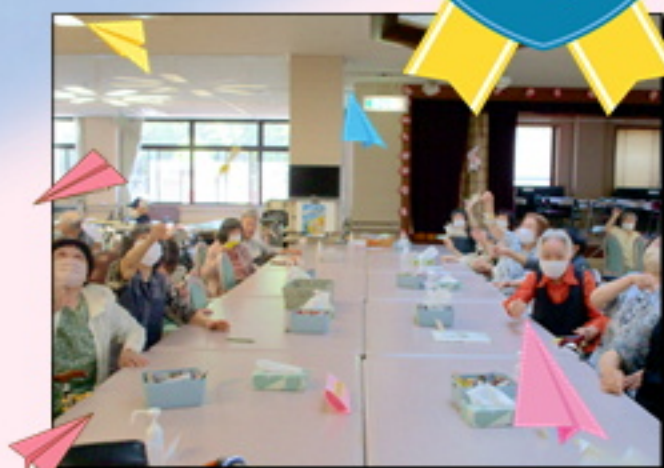
天井を舞った紙飛行機群