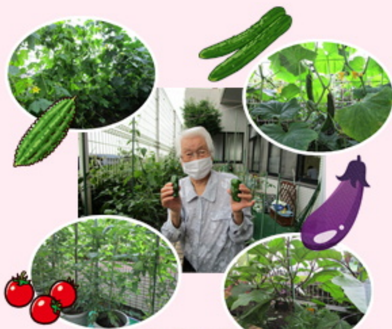
今年の野菜はグングン成長しています。芽の積み方、葉っぱを切り落とすタイミング等、利用者さんに詳しい方が多くいますので勉強になります。